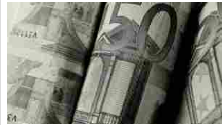
Bonus 80 euro, chi deve restituirli e perché